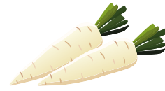
หัวไชเท้า

2 ให้ระบุรสชาติในช่องว่างให้ตรงกับตำแหน่งการรับรสของลิ้นให้ถูกต้อง