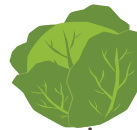
กะหล่ำปลี