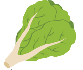
ผักกาดขาว