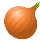
หอมหัวใหญ่